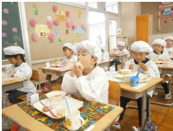
一年生を迎える会